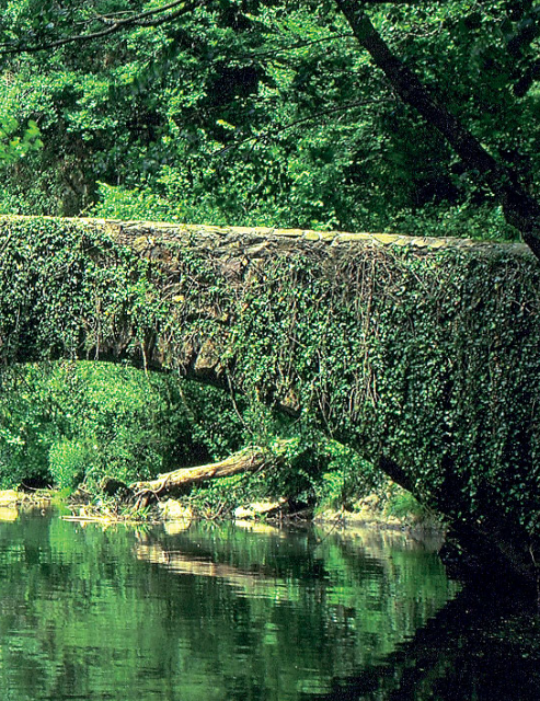
Andoainen, sorginen zubiak Leitzarar ibaiaren gurutzatzen du.