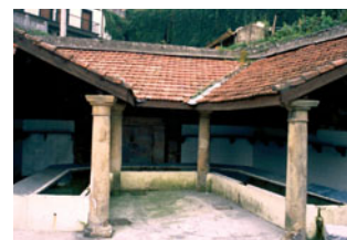
Leokako Ikuztegia (Hernani)