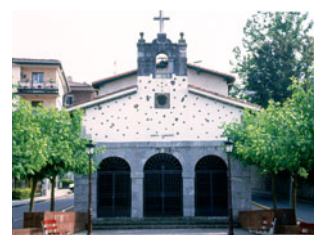
Santa Leocadia Ermita (Urnieta)

1615. urtetik hiribildua da. XVI. mendekoa den eta XVII eta XVIII. mendeetan eraberritua izan zen San Juan Bautista eliza aipagarria da.