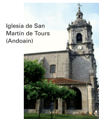
Iglesia de San Martín de Tours (Andoain)