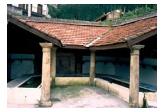
Lavadero de Leoka (Hernani)