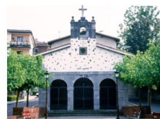
Ermita de Santa Leocadia (Urnieta)

Villa desde 1615, en la que destaca la iglesia de San Juan Bautista , del siglo XVI, con remodelaciones en el XVII y XVIII.