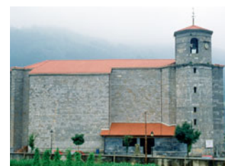
Iglesia de San Martín de Tours (Amasa)